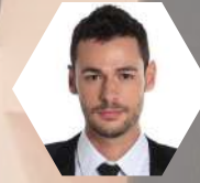
Adrián Buenaventura Audiovisuales