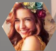
Raquel Poblador Vestuario