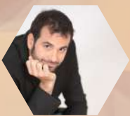
JJ SANCHEZ Iluminación